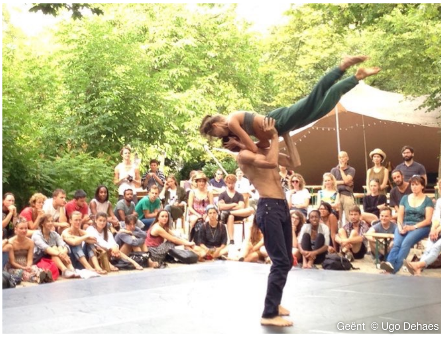
Geënt © Ugo Dehaes