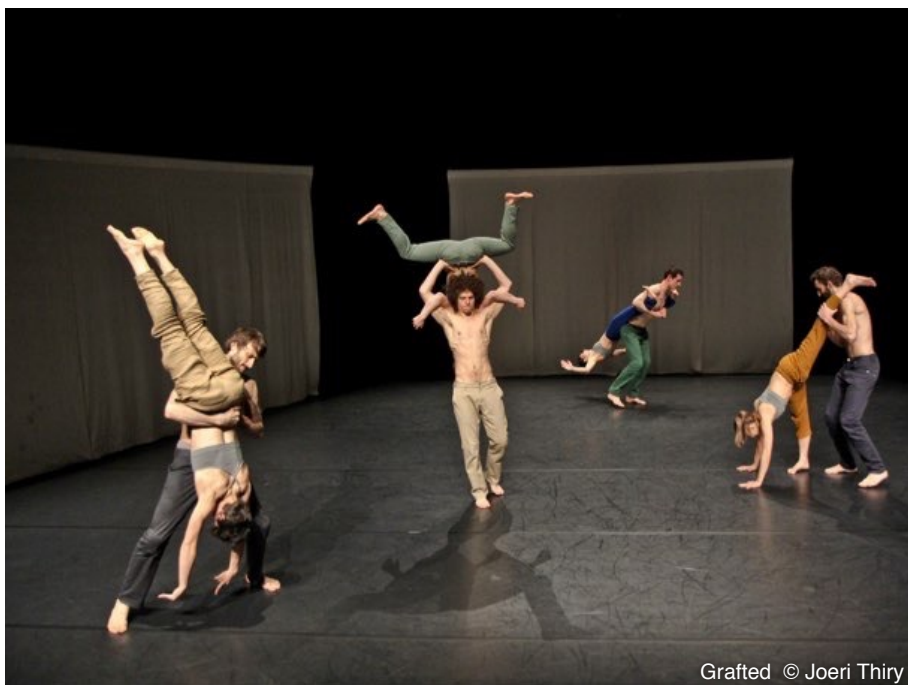
Grafted