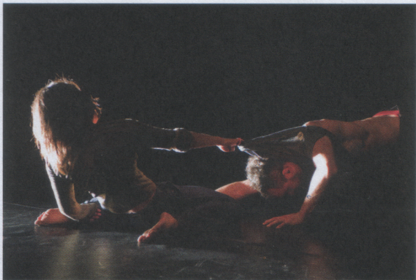
Couple Like

die pirouette zo brengen dat die nieuw is en tegen hun verwachtingen in. Zo is het ook wanneer je rekening houdt met je publiek. Je speelt met verwachtingen en weet hen toch te verrassen. Het is een uitdaging die mij inspireert tot dingen waar ik zelf niet zou opkomen.