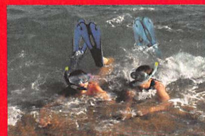
Shade-dough © Soma Storch