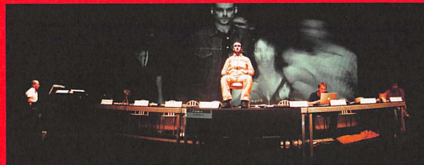
Assassins © Davis Freeman

Gebaseerd op een onderzoek naar de vier universele krachten die onze wereld beheersen. Basé sur une étude des quatre forces universelles qui dominent notre monde. Based on a study of the four universal forces that dominate our world.