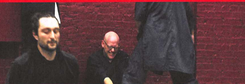
Other People's Pain © Jeremy Xido