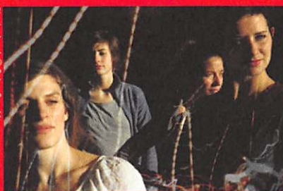
Komposition © Anne Juren