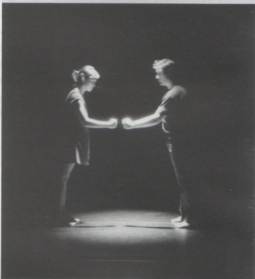
Ugo Dehaes – Forces © Ugo Dehaes

Omdat ik erg visueel ben ingesteld, kan ik me veel beter uitdrukken met mijn lichaam, met beelden. Daarom hou ik zo van hedendaagse dans. Dat is een fantastische kunstvorm omdat het alles of niks kan zijn, zolang er maar beweging of een lichaam te zien is. Bovendien voel ik me veiliger op een podium dan in de echte wereld, op straat. Een