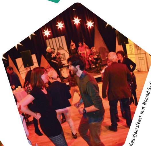
Nieuwjaarsfeest met Nomad Swing