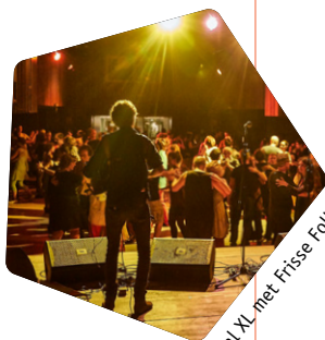
Bal Nr. met Frisse Folk