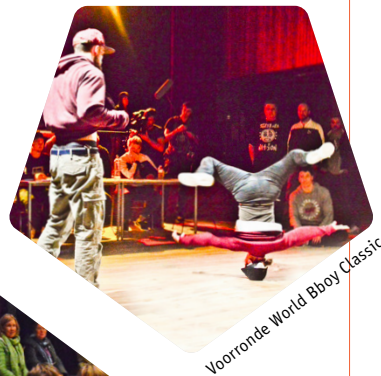
Voorronde World Bboy Classic