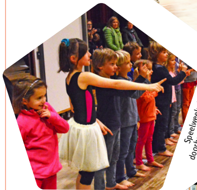
Speelweek: 'Dansen doorheen de filmwereld'