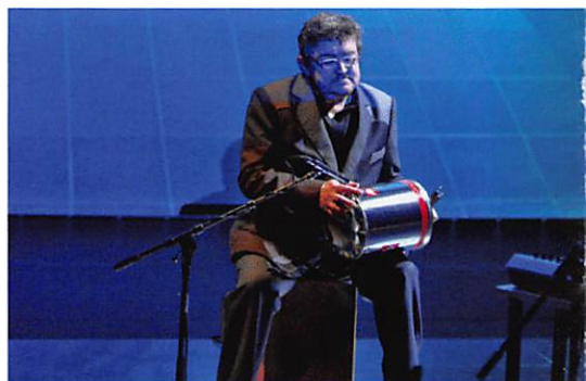
Orkater Een Blauwe Vrijdag

AANVANG 21.00 UUR PRIJS € 15 / VF*PAS € 13