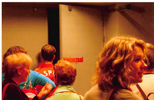
Rondleiding in de Verkadefabriek