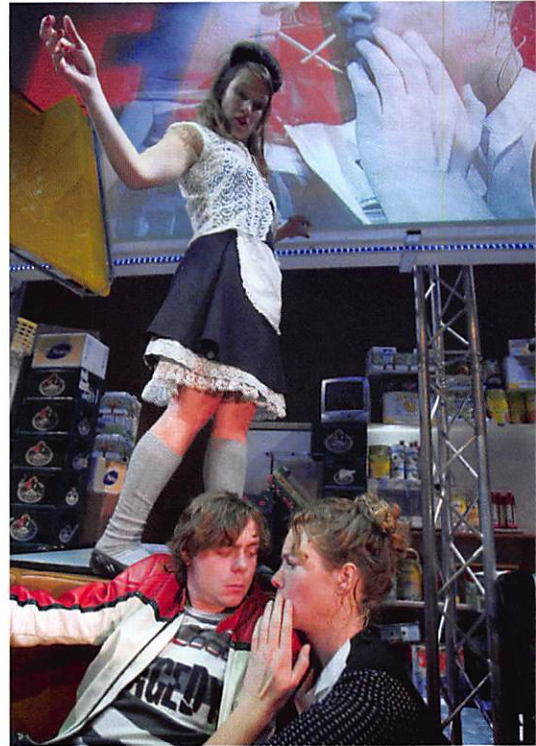
Theatergroep Max. Dochters van Lear