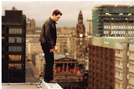
Willbur wants to kill himself

Willbur probeert zichzelf keer op keer van het leven te beroven maar vooralsnog is hij daar niet in geslaagd. Zijn unieke aantrekkingskracht, vooral op vrouwen, zijn pit en charme kunnen niet verhullen dat hij gebukt gaat onder groot pessimisme. De desillusie bij Willbur is zo groot dat hij ernstige vraagtekens zet bij de zin van zijn leven op aarde. Dat in tegenstelling tot zijn oudere optimistische broer Harbour. Regie Lone Scherfig DK 2002 Met Amie Sives, Adrian Rawlins en Shirley Henderson 111 min. 6+