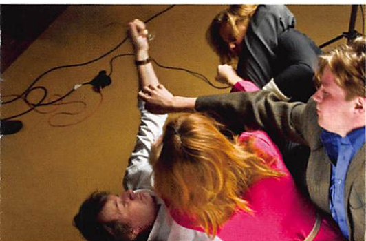
Keessen en Co Richard I