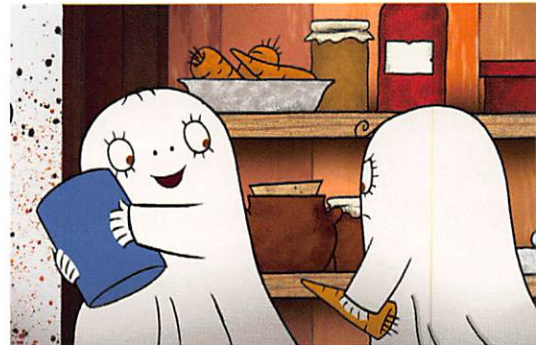
Spooktijd met Laban

Regie Per Åhlin e.a. S 2007 43 min. Animatie