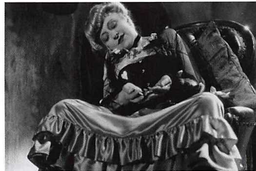
The Robber Symphony