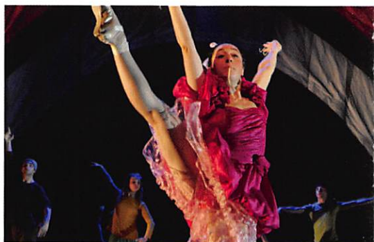
Meekers Uitgesproken Dans Alfabetsoep

In een herberg zingt een zangeres hysterisch over stormachtig weer en kabbelende bergbekken. Dan komen er luidruchtig vier mannen binnen. Klaar voor de jacht. Ze willen worst en oefenen op hun hoorns. Ze spelen dwars