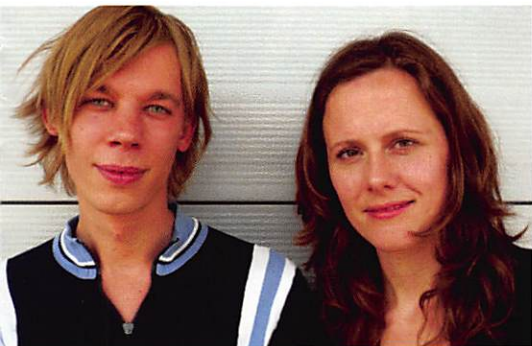
Het Zuidelijk Toneel/Toneelgroep Cargo Bloedjeuk/Hartruis